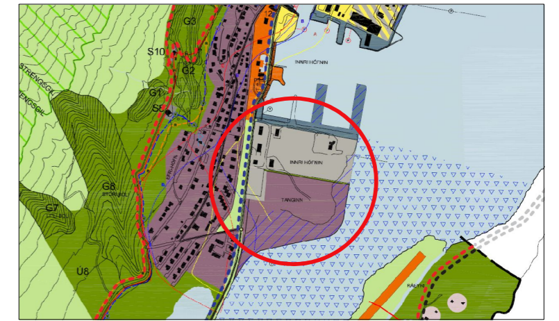
Aðalskipulag Fjallabyggðar 2008-2028 m.s.br.