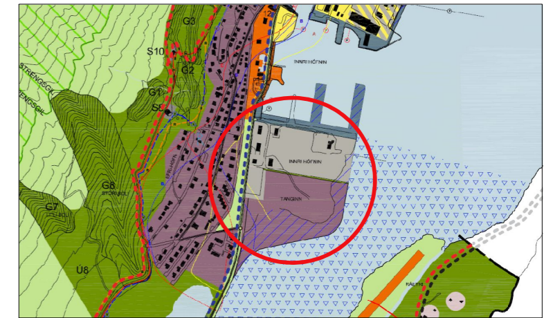
Aðalskipulag Fjallabyggðar 2008-2028 m.s.br.