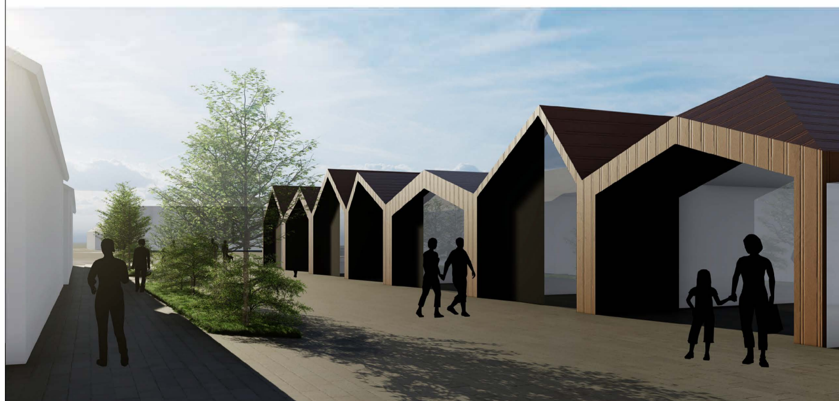
Aðgengi í verslanir frá göngugötu