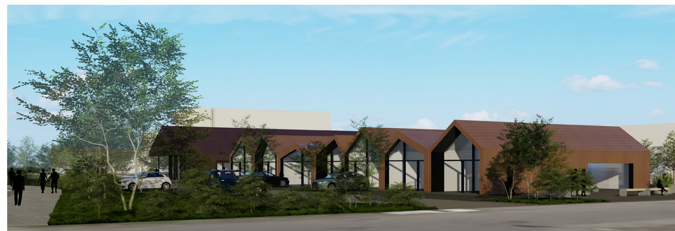
Ásýnd á verslunarkjarna frá Snorrögötu