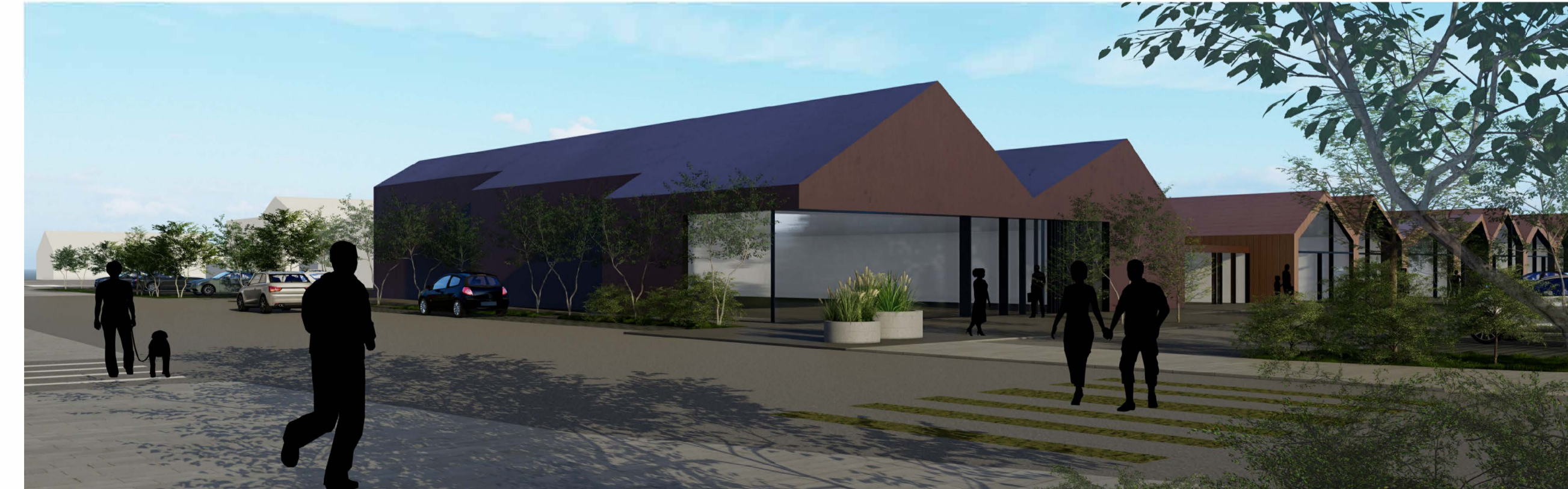
Nærmynd af verslunarkjarna