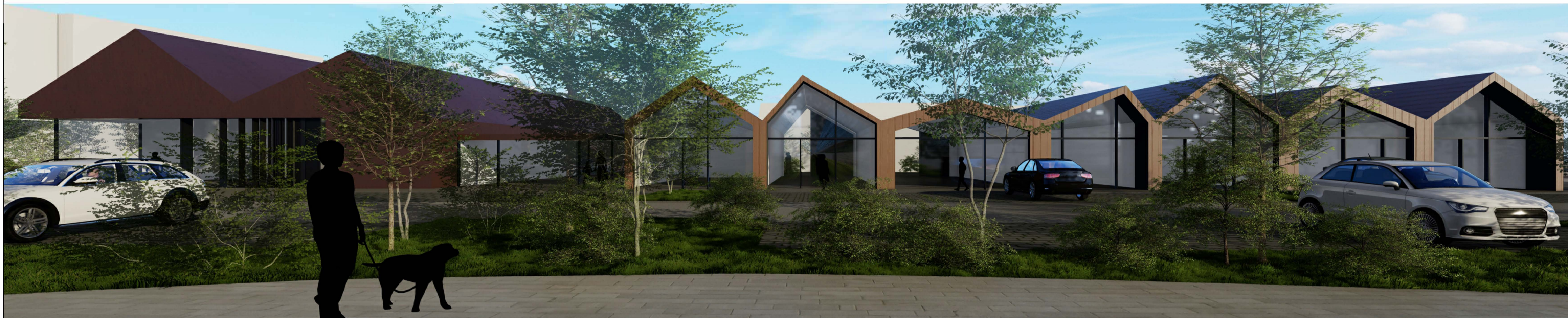
Ásýnd á verslunarkjarna