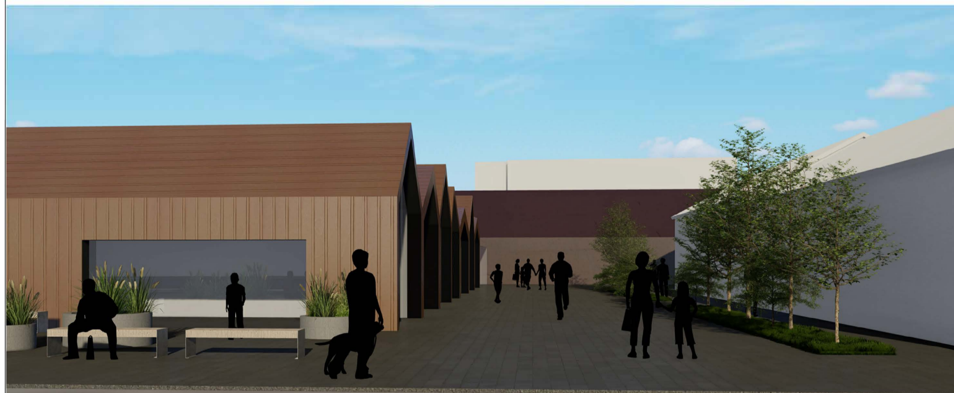
Séð inn í göngugötu