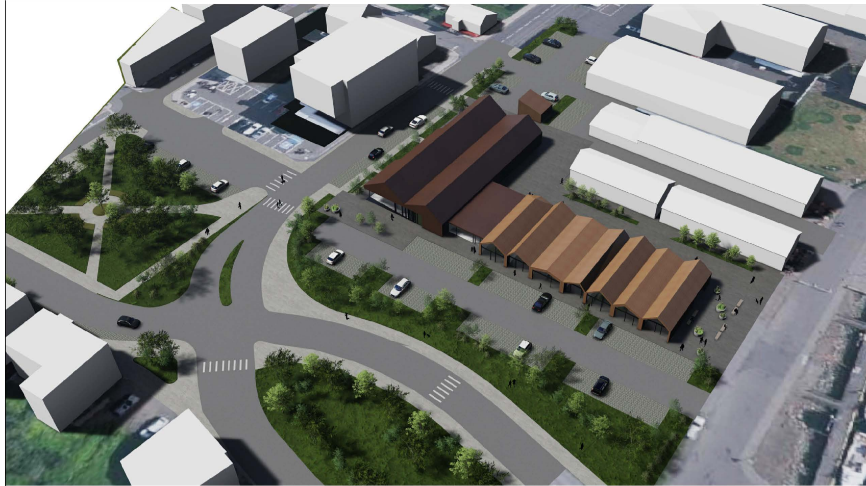
Afstaða á lóð og tenging við nærumhverfi