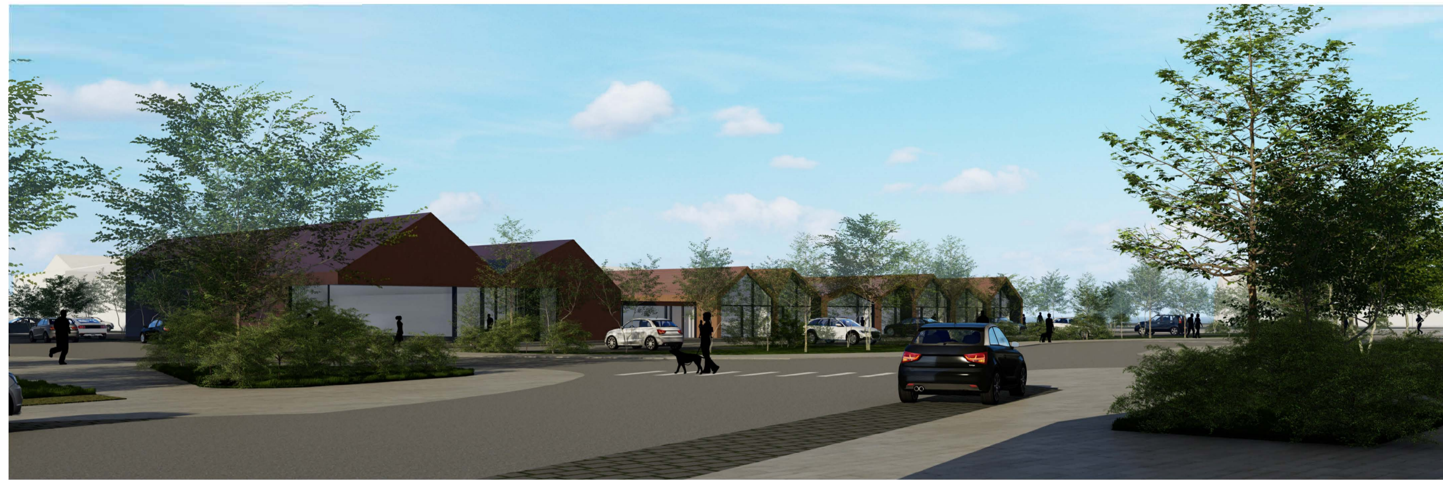
Á horni Gránugötu