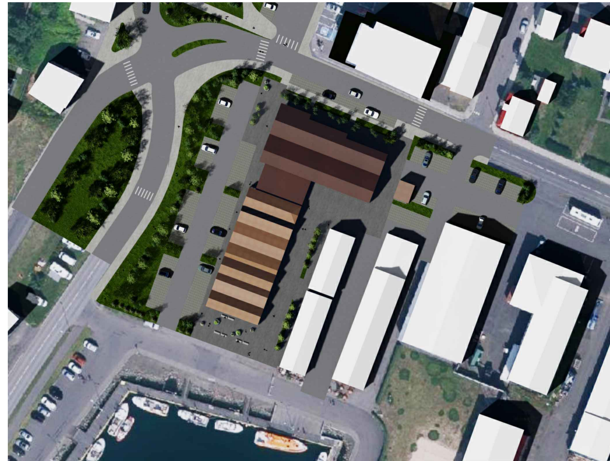
1. júní kl. 16.00