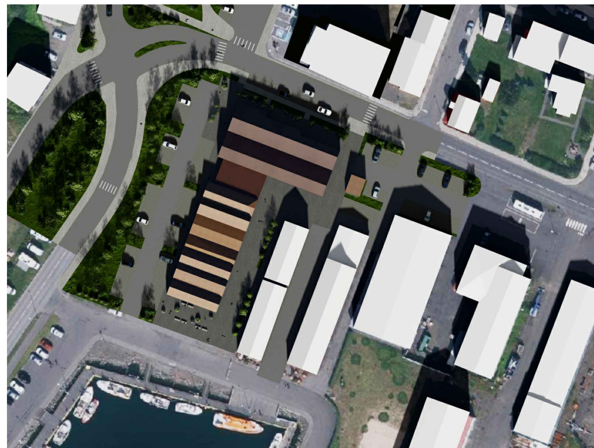
20. september kl. 13.00