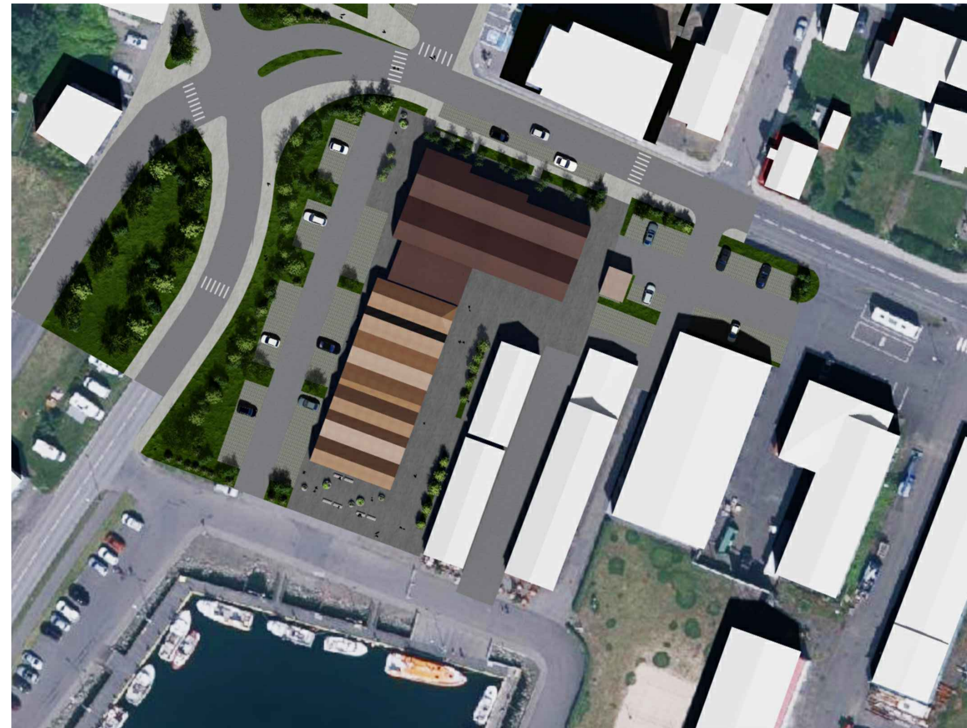
1. júní kl. 13.00