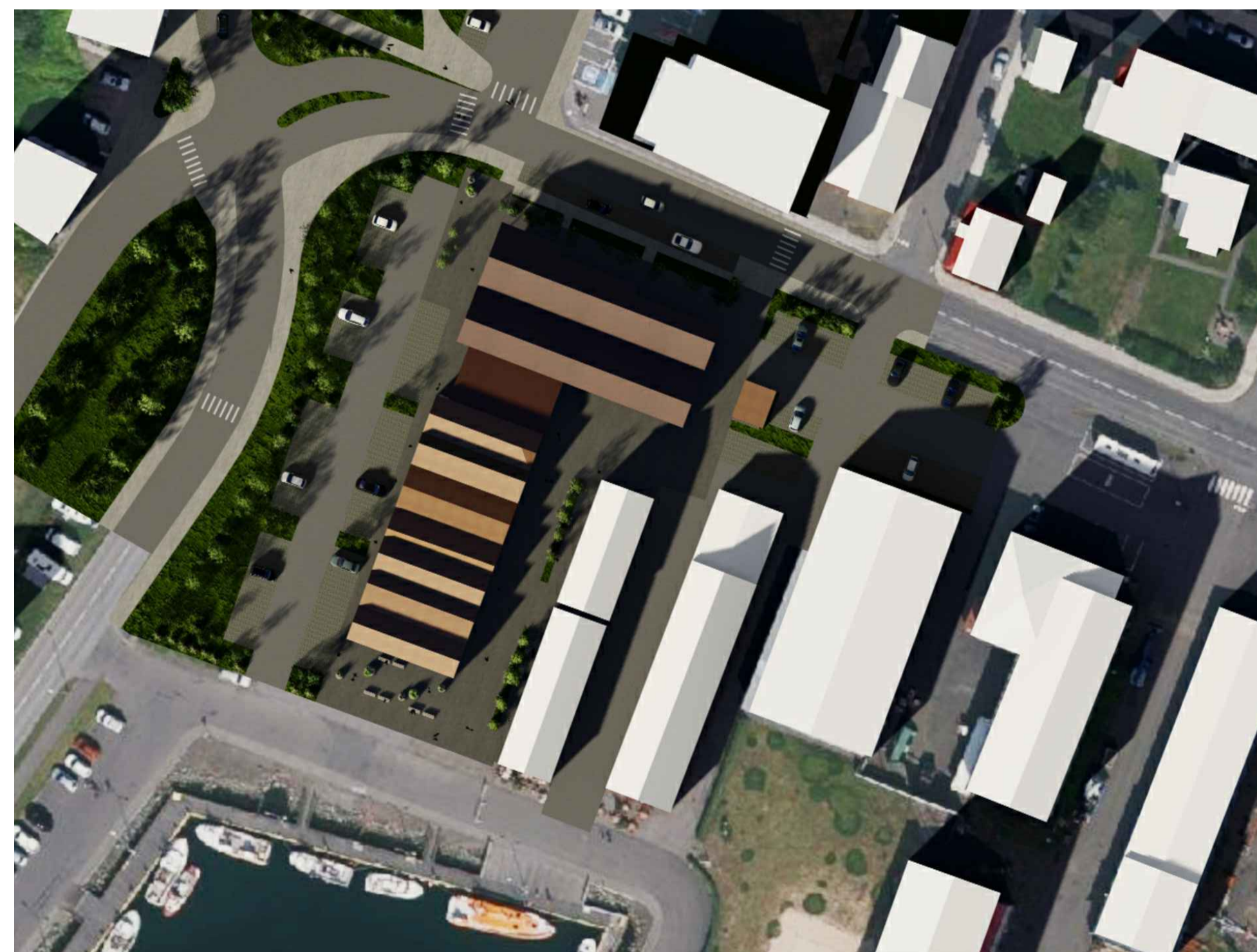
20. september kl. 16.00