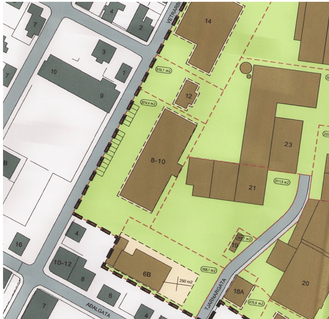
Gildandi deiliskipulag ekki í kvarða