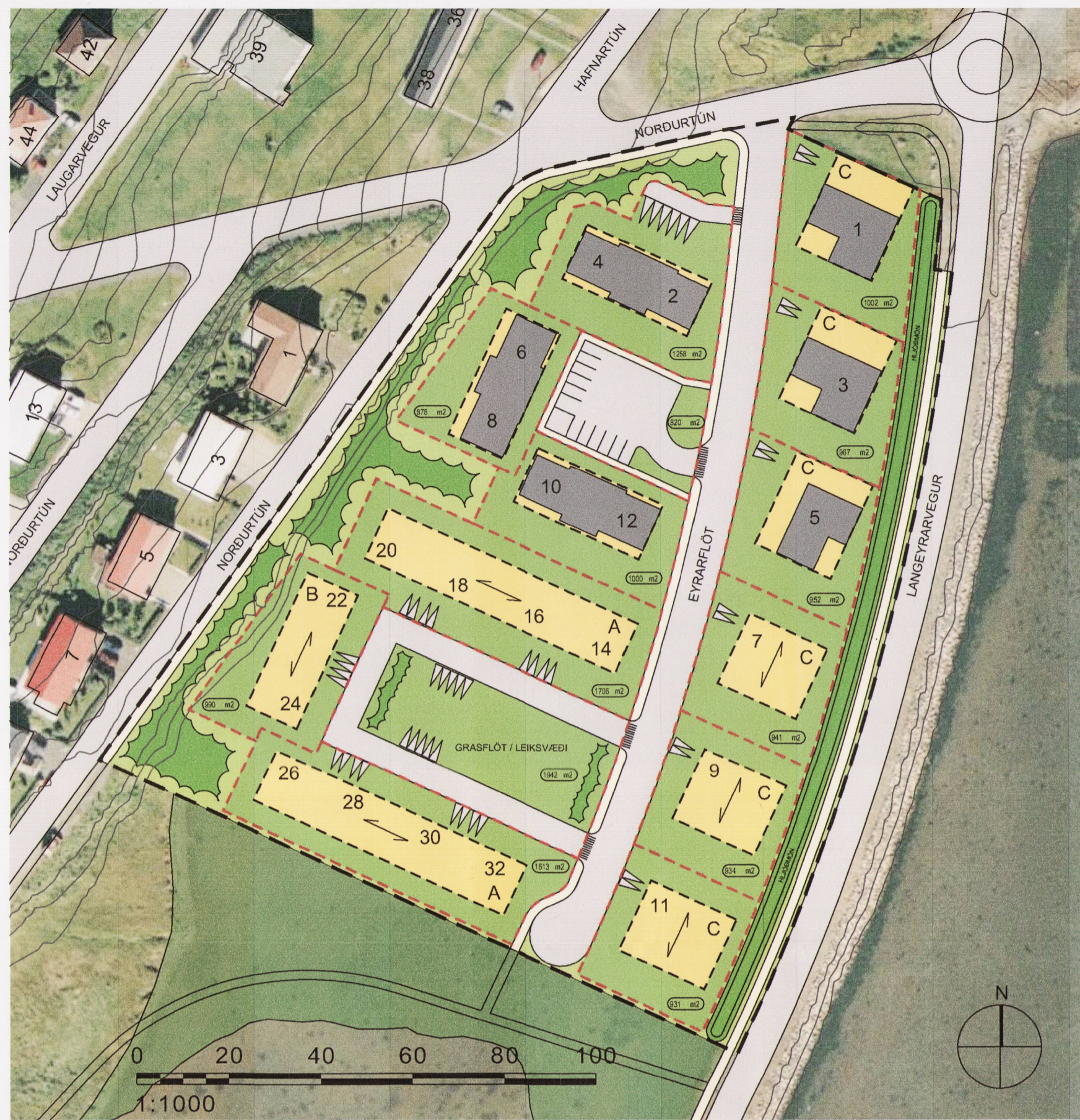
GILDANDI DEILISKIPULAG, ÖDLADIST GILDI 19.07.2013