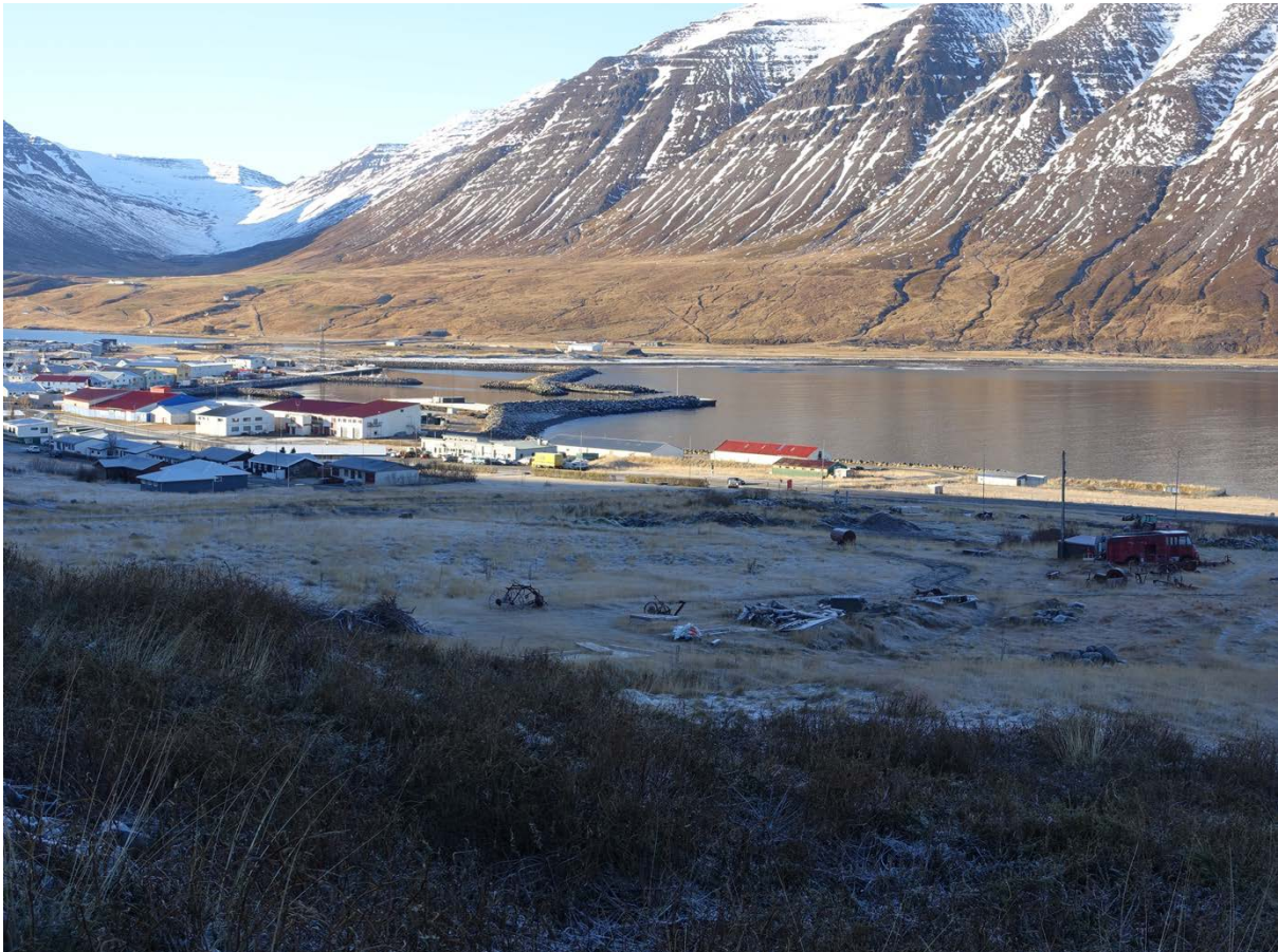
Mynd 3. Horft til vesturs yfir skipulagssvæðið - mynd tekin í lok október 2023