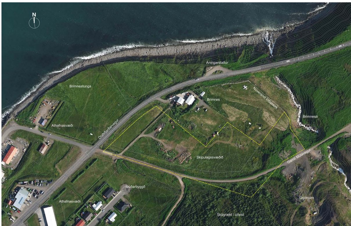
Mynd 3. Loftmynd með hæðarlínum af skipulagssvæðinu og nærumhverfi.

Samkvæmt gildandi aðalskipulagi er skipulagssvæðið skilgreint sem óbyggt svæði með möguleika sem framtíðar íbúðasvæði (ÓB 303). Nýr grafreitir getur því orðið hluti hverfisgarðs síðar meir. Ólafsfjarðarvegur afmarkar skipulagssvæðið til norðurs og vesturs. Gamli Múlavegurinn afmarkar svæðið til suðurs og til austurs mun núverandi húsakostur og möguleg starfsemi þar við verða að einhverju leiti sýnileg til að byrja með. Æskilegt verður afmarka þessa línu með kvöðum í deiliskipulagi. Lagning gönguleiðar meðfram Ólafsfjarðarvegi frá miðbæ að áningarstað Vegagerðarinnar norðan við Brimnes er líkur 2024. Aðgengi að skipulagssvæðinu er gott.