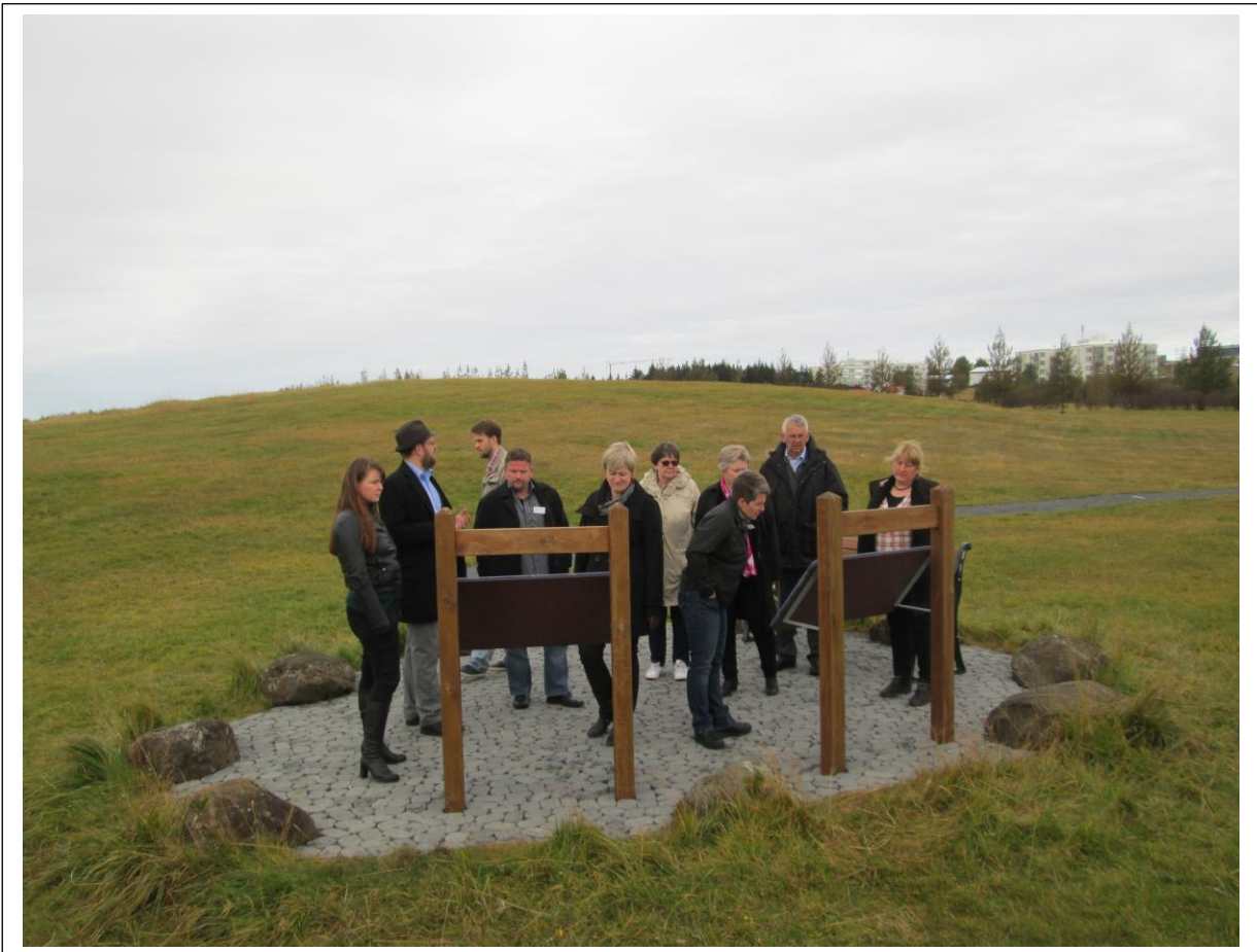
Mynd 4. Nokkrir héraðsskjalaverðir fengu sér heilsubótargöngu milli erinda á haustfundinum í Kópavogi.

auðveldan hátt. Alls hafa verið skráðar eldri skjalaöskjur 365 talsins sem gera 29,20 hillumetra.