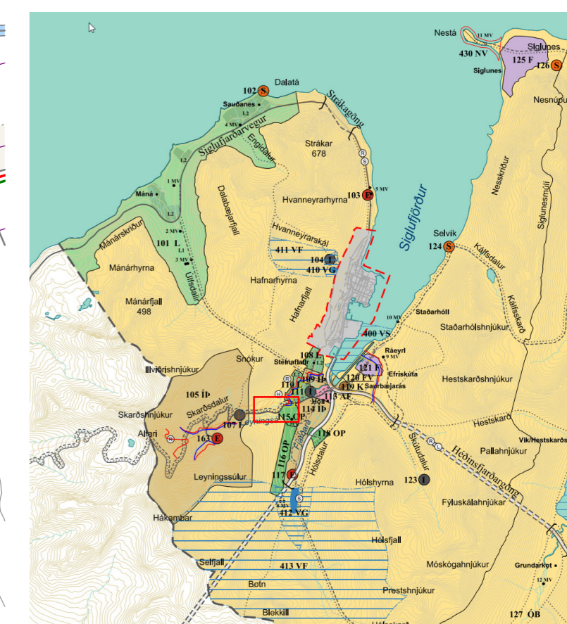
Áðalskipulag Fjallabyggðar 2020-2032