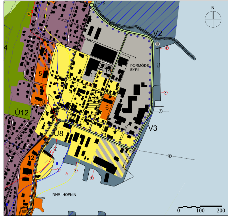
Staðfest aðalskipulag, staðfest 22.12.2010