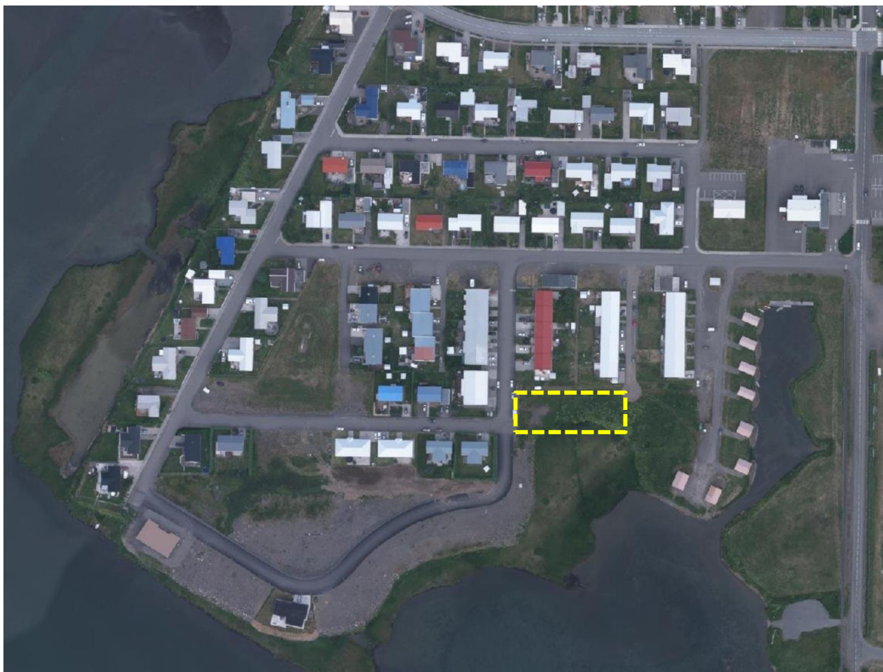
Mynd 1. Loftmynd sem sýnir staðhætti, gul brotin lína sýnir það svæði sem breytingin nær til.

Skv. skipulagslögum nr. 123/2010 skal við upphaf vinnu við gerð skipulagsáætlunar, aðalskipulagsbreytingar í þessu tilfalli, taka saman lýsingu á skipulagsverkefninu þar sem m.a. er skýrt hvernig staðið verði að skipulagsgerðinni.