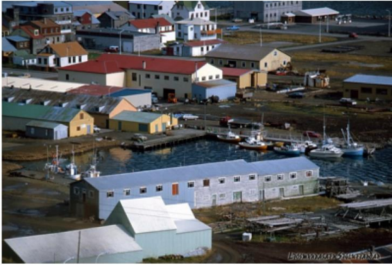
Frá 8 áratug 20 aldar.