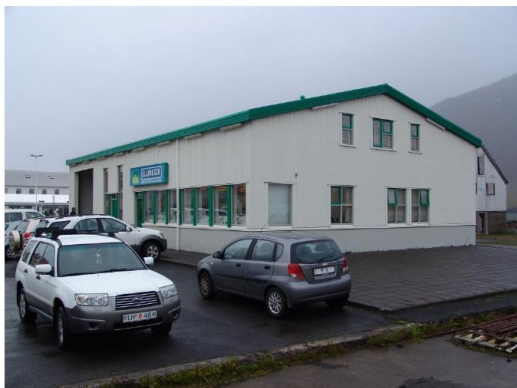
2011. Ásýnd frá Tjarnargötu