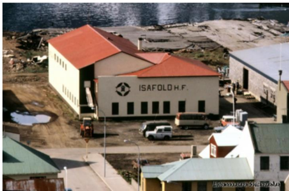
Frá 6 áratug 20 aldar