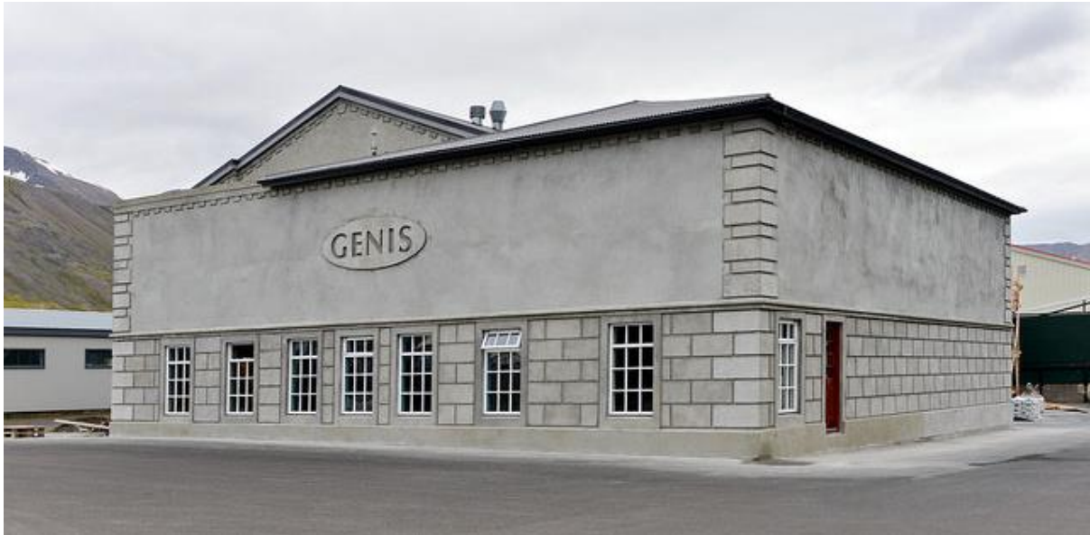
Mynd 10 Gránugata 15 var endurbætt árið 2014 og hýsir nú lyfjaframleiðslufyrirtækið Genís. (Magnús Rúnar Magnússon, 2014)

Reisulegt steinsteypt verksmiðjuhús í nútímalegum anda. Húsið er hluti götummyndar og hverfisheildar og nokkuð upprunalegt. Ástand þess er mjög gott. Það hefur varðveislugildi vegna byggingarlistar, menningarsögu og umhverfis. Húsið er hluti af varðveisluverðri samstæðu húsa og heilda. Í húsaskráningu er lagt til að húsið verði verndað með hverfisvernd í deiliskipulagi (Kanon arkitektar, 2012).