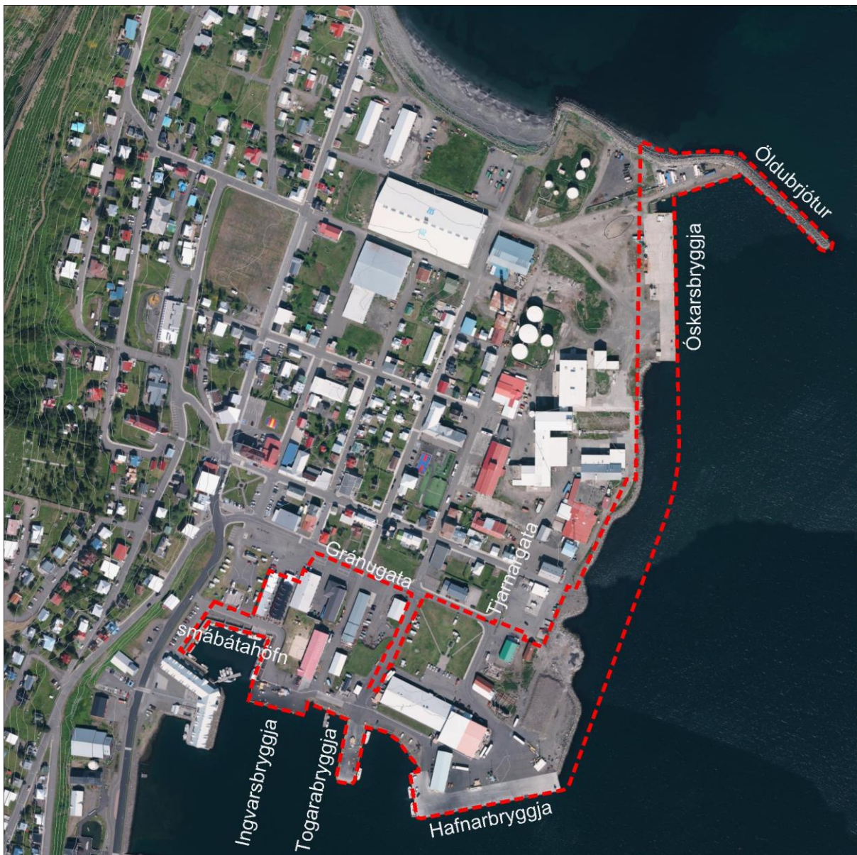
Mynd 1 Afmörkun skipulagssvæðis á loftmynd sem tekin var árið 2021.

Skipulagssvæðið er 9,25 ha að stærð og nær til hafnarsvæðis og athafnalóða. Það afmarkast af smábátahöfn í vestri, Rauðku og Gránugötu, athafnasvæði við Tjarnargötu og Öldubryjót í norðri.