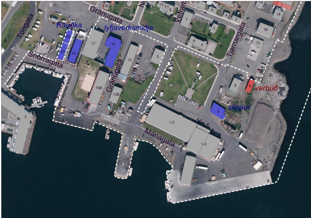
Mynd 2 Tillaga húsaskráningar að hverfisvernd (blá hús) og friðuð hús (rautt hús).

Friðuð hús skv. lögum um menningarminjar nr. 80/2012 (100 ára og eldri).