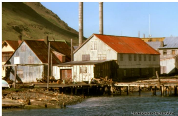
Mynd líklega frá sjötta áratug 20 aldar