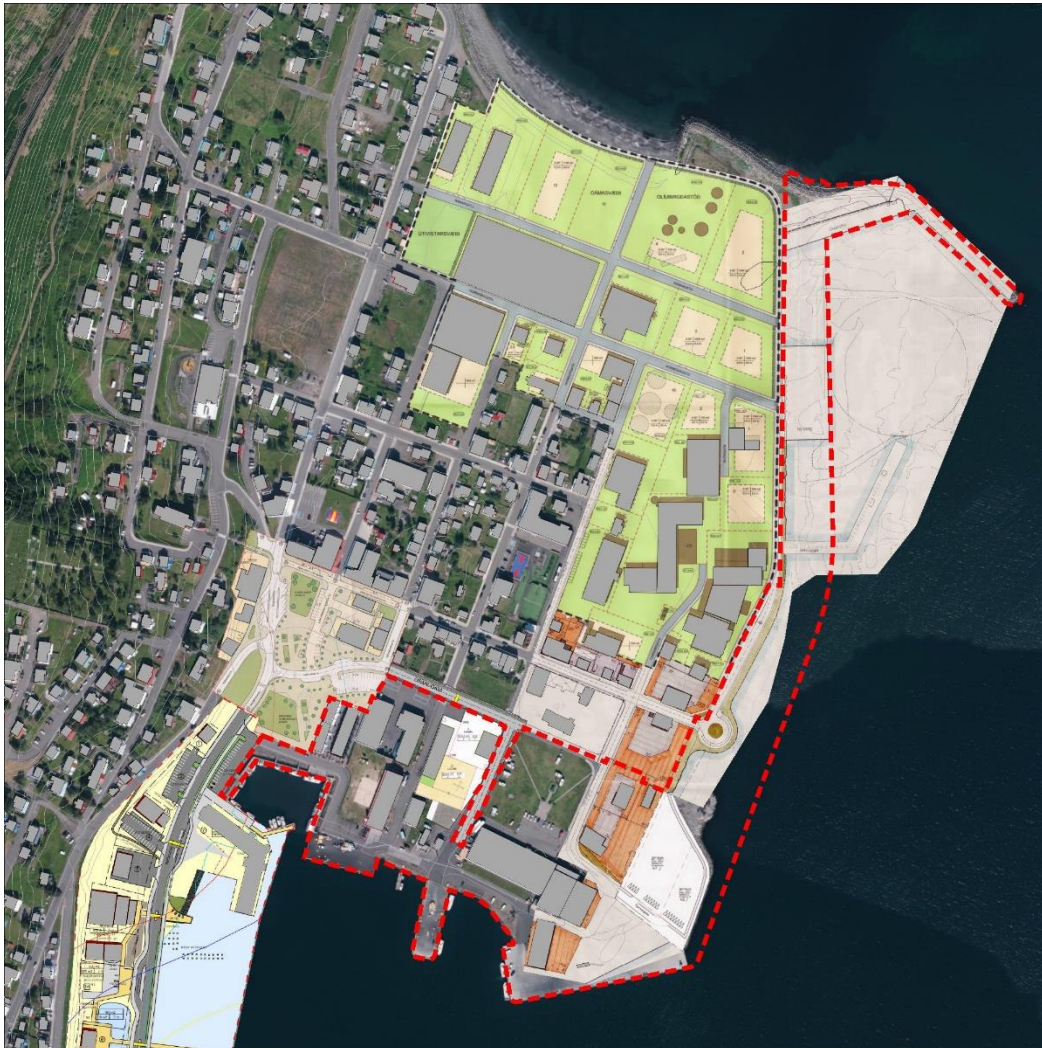
Mynd 21 Gildandi deiliskipulög og mörk skipulagssvæðis sýnd með rauðri brotalínu.