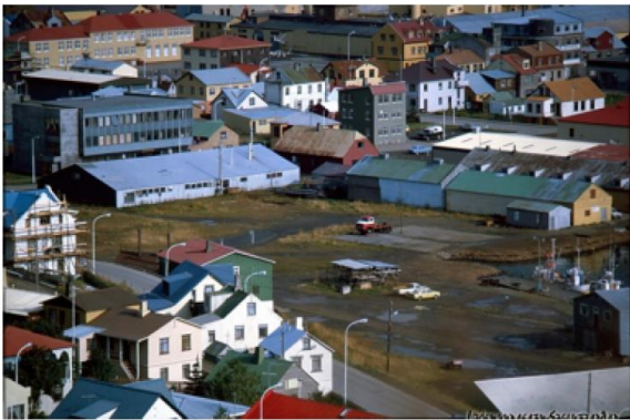
Frá 7 áratug 20 aldar