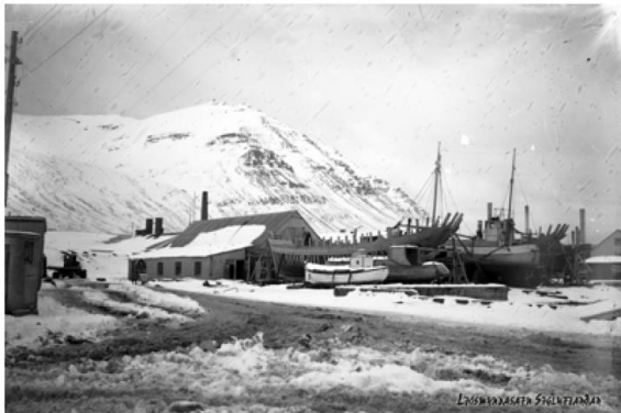
Frá fyrri tíð - ásjúnd frá Hafnarbryggju