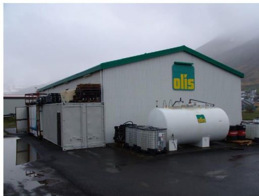
2011. Ásýnd norðurgafls

Mynd 18 Myndir úr húsaskráningu Siglufjarðar af Tjarnargötu 6