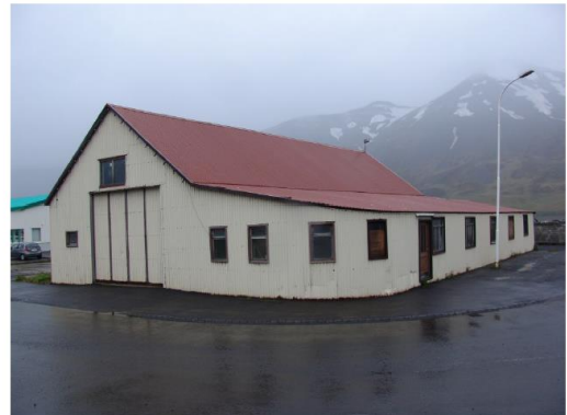
2011. Ásjúnd frá Tjarnargötu

Mynd 17 Myndir úr húsaskráningu Siglufjarðar af Tjarnargötu 2.