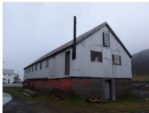
2011. Ásýnd suður og vesturhlíða

Mynd 19 Myndir úr húsaskráningu Siglufjarðar af Tjarnargötu 8.